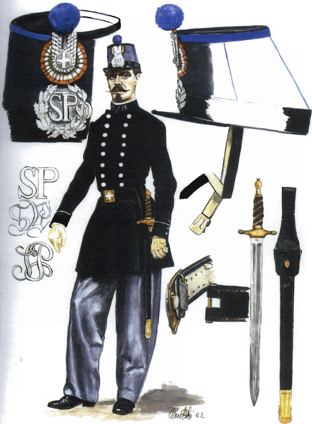
Guardia in tenuta ordinaria - 1852