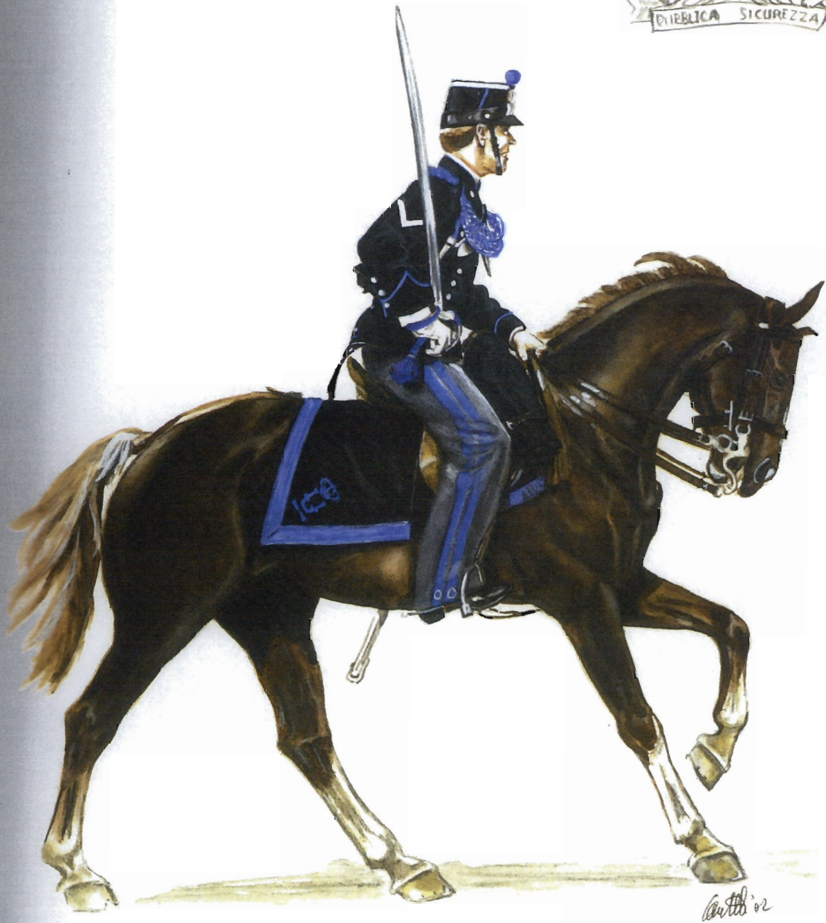
Appuntato in tenuta festiva e di parata – 1883